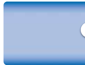
Elementos que compõem a festa

from ' Imaterialidades - Festa de Iemanjá '