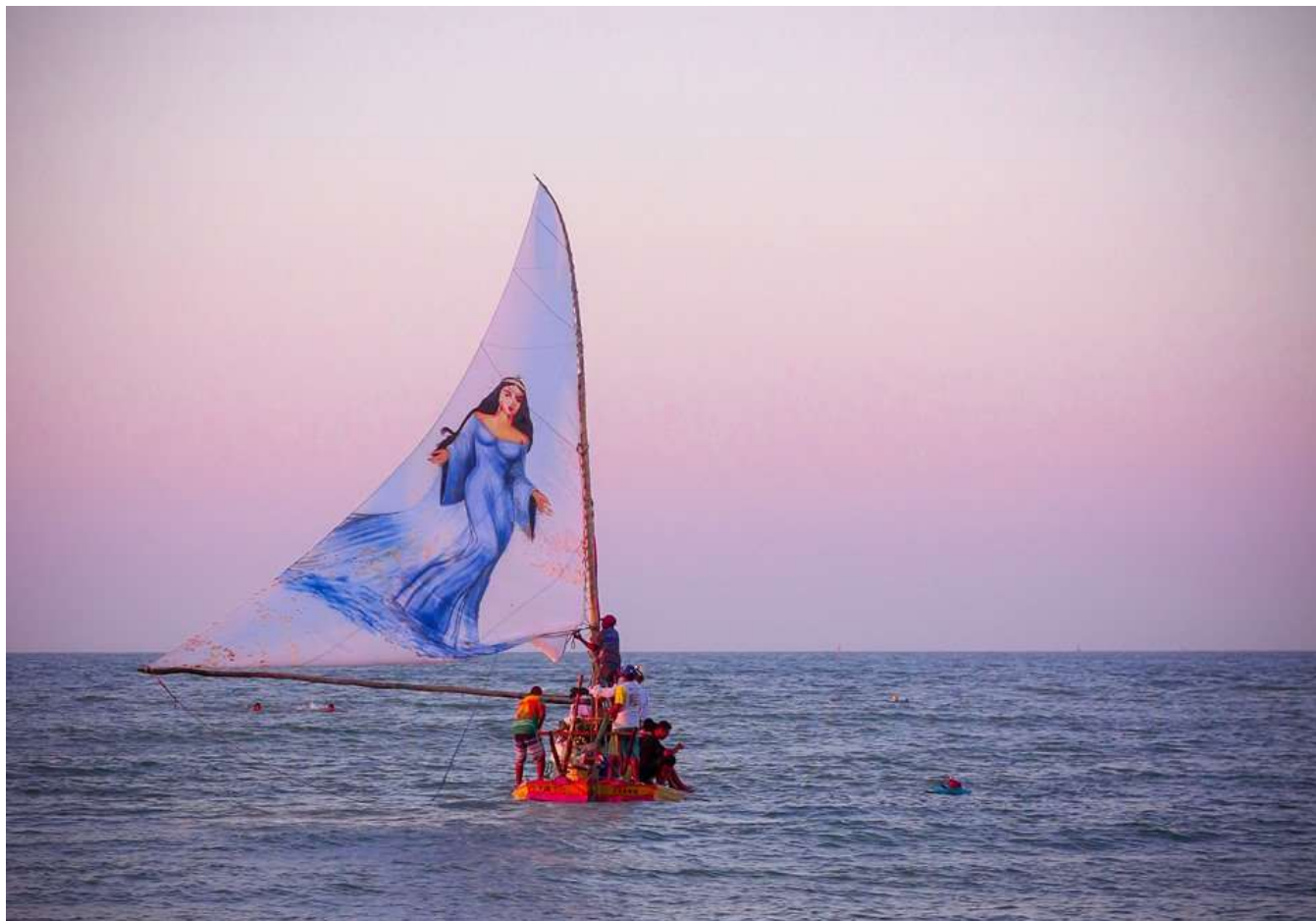
A Festa de Iemanjá é registrada como Patrimônio Imaterial de Fortaleza por meio do decreto nº 14.262 de 30 de julho de 2018

Patrimônio Imaterial de Fortaleza, a Festa de Iemanjá será comemorada nesta quarta e quinta-feira (14 e 15/08), nas Praias do Futuro e de Iracema. Principal festividade do calendário de umbanda da capital cearense, a celebração reúne grupos culturais de diversas cidades e conta com o apoio da Prefeitura de Fortaleza, por meio da Secretaria Municipal da Cultura de Fortaleza (Secultfor).