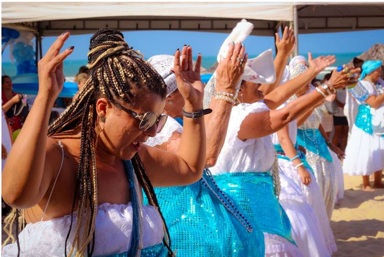
Patrimônio Imaterial de Fortaleza, a Festa de Iemanjá será comemorada nesta quarta e quinta-feira (14 e 15/08), nas Praias do Futuro e de Iracema

A Prefeitura de Fortaleza realiza, por meio da Secretaria Municipal da Cultura de Fortaleza (Secultfor), mais uma semana de atividades culturais gratuitas espalhadas em equipamentos públicos da cidade. Entre as ações, são destaques a programação musical nos mercados dos Pinhões e Aerolândia, a realização da Festa de Iemanjá e a abertura das inscrições para o VIII Edital das Artes, que conta com um investimento de R$ 4,1 milhões em fomento às artes da capital cearense.